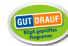
Label nach GUT DRAUF

Wenn eine Einrichtung an einer nachhaltigen, an einheitlichen Qualitätsstandards orientierten Umsetzung von GUT DRAUF interessiert ist, stehen drei unterschiedlich ausgerichtete Verfahren zur Verfügung: