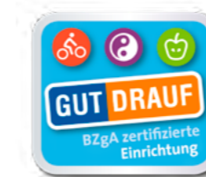
Zertifizierung nach GUT DRAUF

Für GUT DRAUF-Partner, die an einer nachhaltigen, an einheitlichen Qualitätsstandards orientierten Umsetzung von GUT DRAUF in ihrem jeweiligen Handlungsfeld für ihre gesamte Einrichtungsstruktur interessiert sind, bietet sich eine kostenpflichtige Zertifizierung mit einer Laufzeit von drei Jahren an.